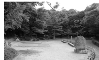
吉田松陰とその妹「文」が生まれ育った、松陰誕生地

となるのは大歓迎です。ただ、もう少し贅沢をいうなら、 防長二州に移封された江戸時代初期にも目を向けてほし いと思います…。 【阿久戸】